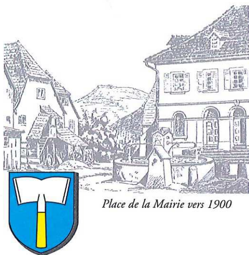
Place de la Mairie vers 1900